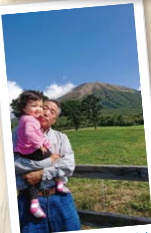
祖父と大山と小さなわたし