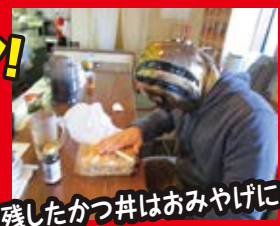
残ったかつ丼はおみやげに...