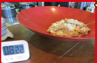
しかし、残り8分、急にピタリと手が止まり...