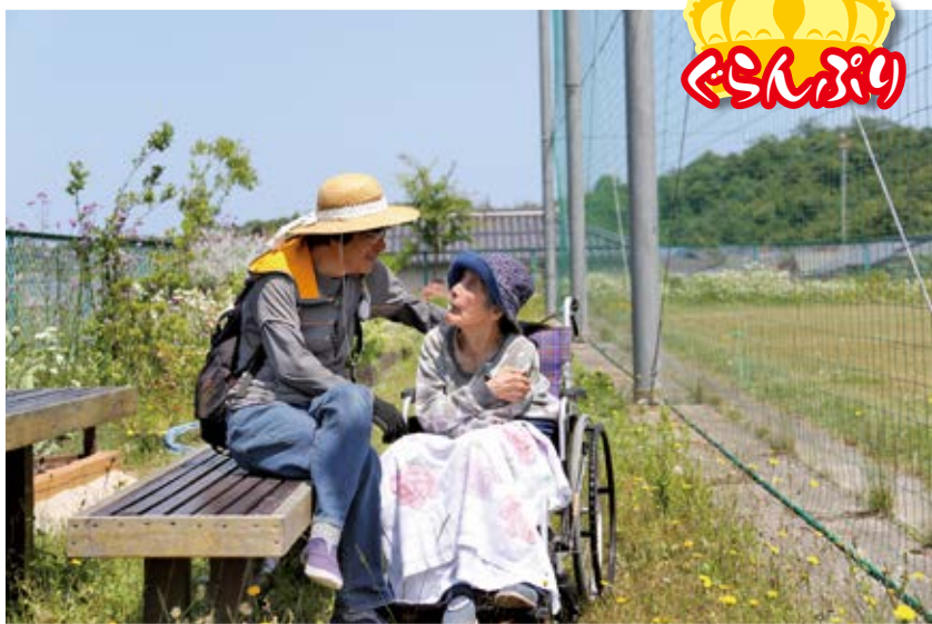
ご家族のひととき