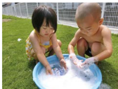
「いま泡であそんでるでしょ?」「う、うん、つい…」