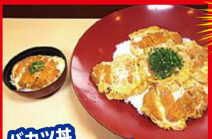
バカツ丼 普通盛りと比べる