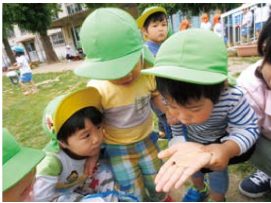
だんごもっつておだんごのあかちゃん?