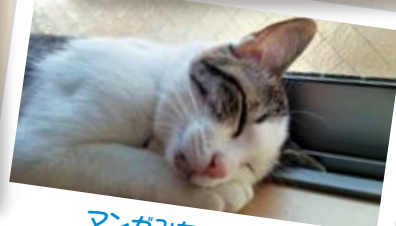
マンガみたいな寝顔