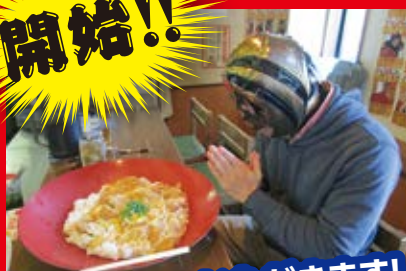
いただきます! いざ、勝負!!