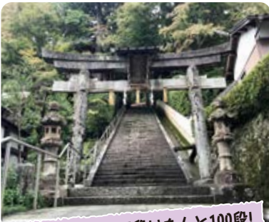
本殿へと続く石段はなんと100段!