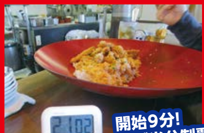
開始9分! ほぼ半分制覇 コレはいける!?