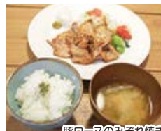
豚ロースのみぞれ焼き

クーポン券ご持参で 「豚ロースのみぞれ焼き」100円引き (平成29年12月末まで有効)