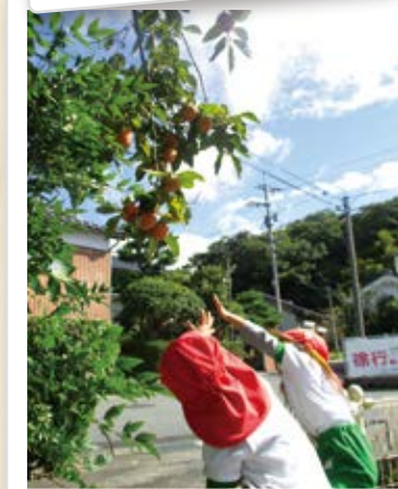
ぜったいとろぞ～! オー!