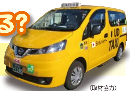
〈取材協力〉 日ノ丸ハイヤー(株)

最近、街中でよく黄色いワンボックスのタクシーを見かけます。そう、これはUDタクシーといって、ユニバーサルデザイン化されたタクシーなのです!