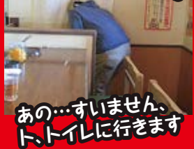
あの...すいません、ト、トイレに行きます