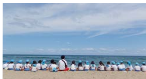
海の声が聞こえるね