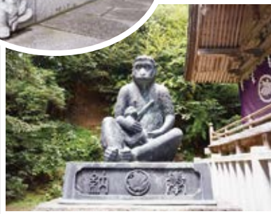
お猿さんがあんなところやこんなところにも!