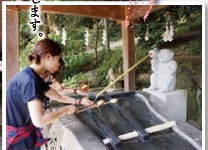
まずは手水舎でお清め