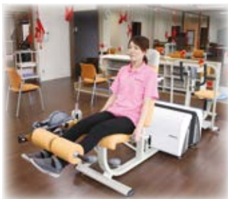
レッグエクステンション

下肢筋全般の筋肉を強化し、立ち上がる、座る、しゃがむ、歩く等、日常生活に必要な筋力を強化します。