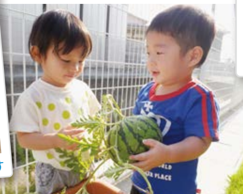
汗と努力の結晶だね