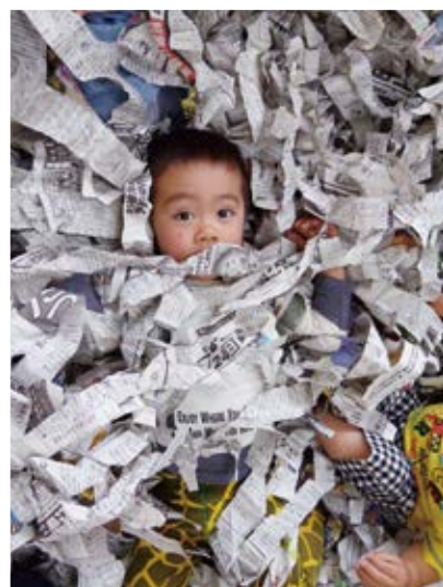
ミノムシに変身中