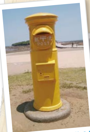
しあわせポスト ※本物です