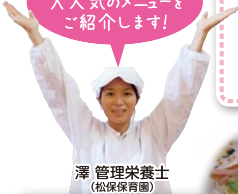
澤 管理栄養士 (松保保育園)