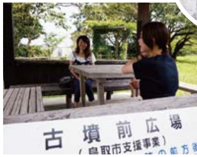
古墳前の広場でひとやすみ♪