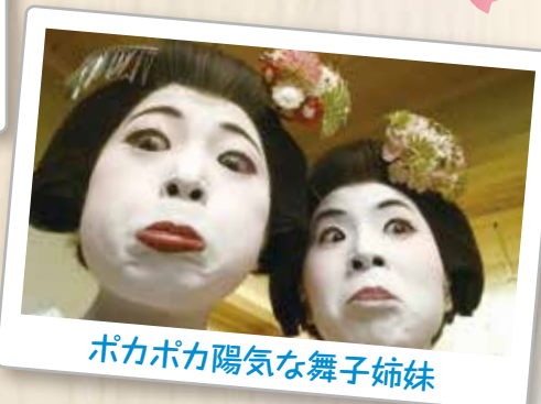
ポカポカ陽気な舞子姉妹