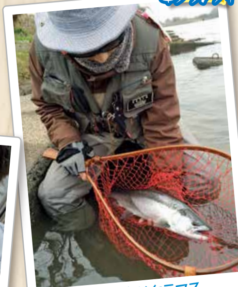
3月1日春サクラマス