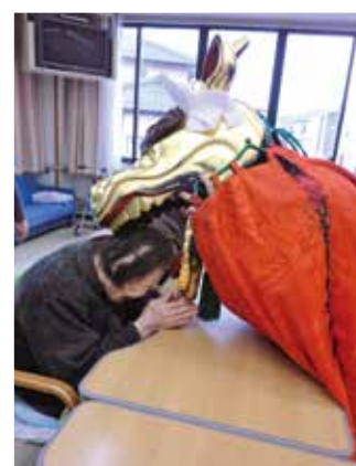
噛んでもらってありがとう!