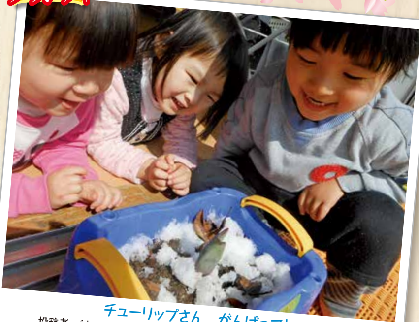
チューリップさん がんばって! 投稿者 謎の保育士 『なごり雪と芽吹き...実に風情がありますね。』