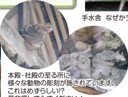
本殿・社殿の至る所に様々な動物の彫刻が施されています。これはめずらしい!?是非探してみてください♪