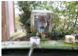
手水舎 なぜかライオンの口から…