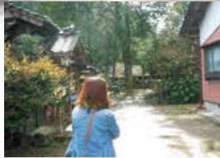
鳥居をくぐり、参道を歩くと…

生涯の伴侶をなぜか神だのみで探す独身貴族な美女2人…そんな2人が鳥取のパワースポット「神殿」を巡るこのコーナー。第5弾は鳥取市河原にあります『売沼神社』をご紹介します！