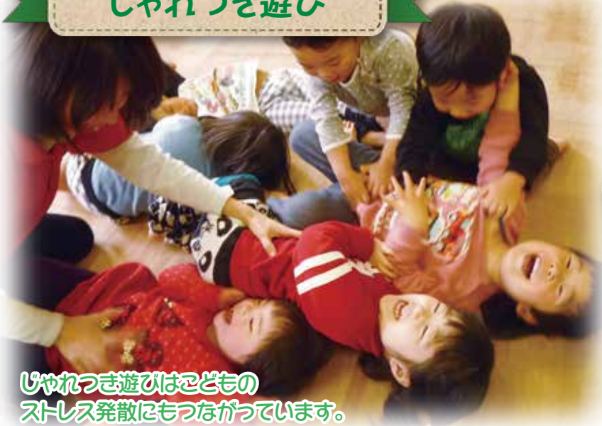
じゃれつき遊びはこどもの ストレス発散にもつながっています。

じゃれつき遊びをはじめとして、 お茶会、汽車遠足など・・・ 楽しさいっぱいです。