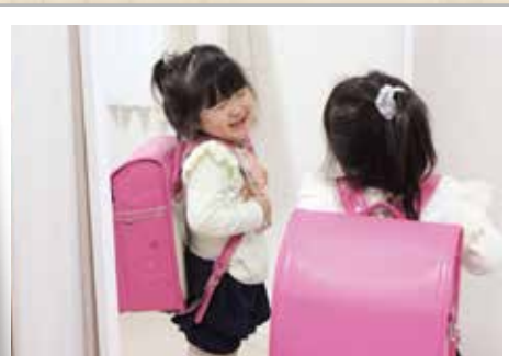
ピカピカの1年生 女の子編