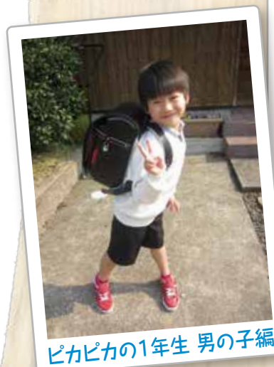
ピカピカの1年生 男の子編