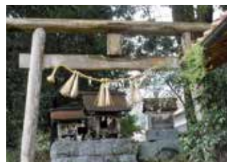
本殿右隣りにある熊野神社