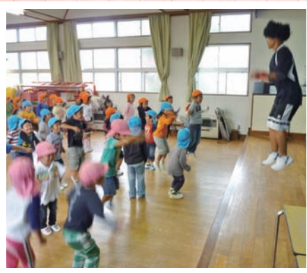
なわとびマンと一緒にジャンプ!!

「楽しそうーやってみようー」と子どもたちの意欲を引き出すよう月に一度の「わくわく☆わかばデー」を実施し、様々な運動遊びにチャレンジしなわとびマンがみんなの応援に来てくれます。