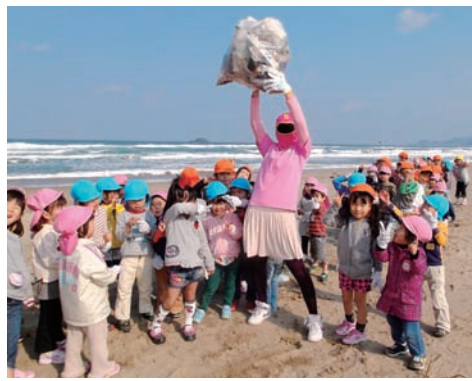
アースレンジャーと一緒に砂丘のゴミ拾いに行ったよ!

年長児が中央図書館に出かけ、いろいろな絵本の世界に親しみ、心を豊かにしています。また、「もじ・かず遊び」を通して「学び」に興味・関心を広げています。